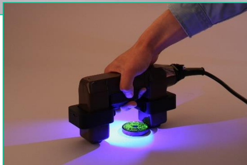
リングBL(別売)と 組み合わせた使用例